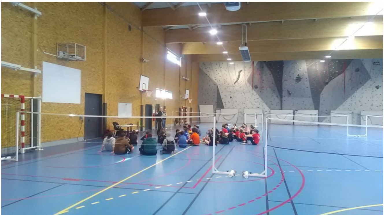
Départementaux B/M 2023 Saint Jean Douai