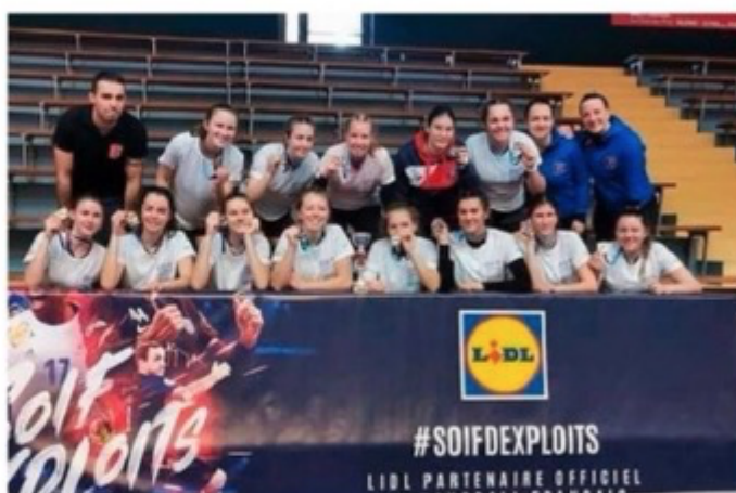
L'équipe a disputé la finale du championnat de France UGSEL à Valence.

de hand composée de douze filles (cinq terminales, six premières, une seconde) à Valence pour y disputer la finale du championnat de France UGSEL (équivalent UNSS dans le privé). Là-bas, elles ont assuré le spectacle puisqu'elles ont raflé le titre au terme d'une finale âpre contre Pouzauges (Vendée). « Elles ont beaucoup appris durant cette aventure qui a commencé en novembre. Lors de cette finale, elles ont