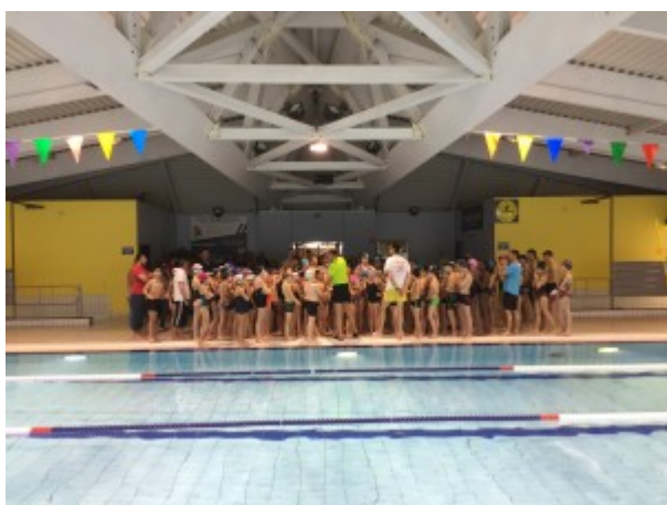
Podiums 25m dos